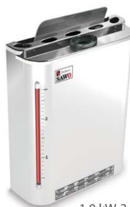
Mini Steam Mate