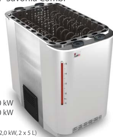
Super Savonia Combi