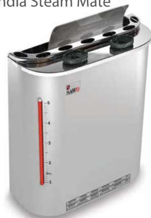
Scandia Steam Mate